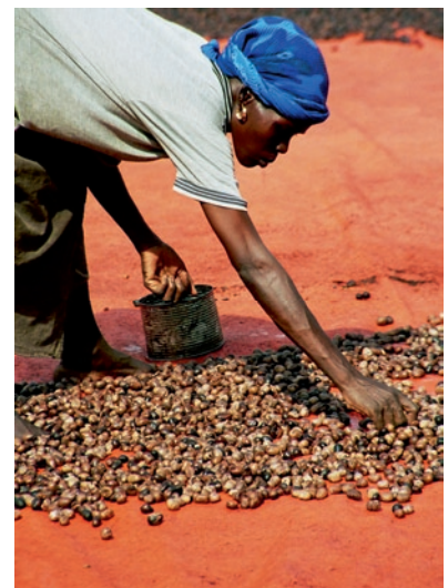
Burkina Faso: Trocknen der Kariténüsse

Diese Entwicklung trug auch zum wirtschaftlichen Wachstum der WALA bei. In den letzten beiden Jahrzehnten gelang es dem Unternehmen, den Heilungsimpuls einer sehr viel breiteren, auch weltweiten Öffentlichkeit zugänglich zu machen. Die Präparate mussten in einer ganz neuen Größenordnung produziert werden und verfügbar sein. Entsprechend wichtig war es, die Verbindung von Natur und Mensch mit den modernen Anforderungen an einen Wirtschaftsbetrieb zu verknüpfen. Dafür sorgen die mehr als