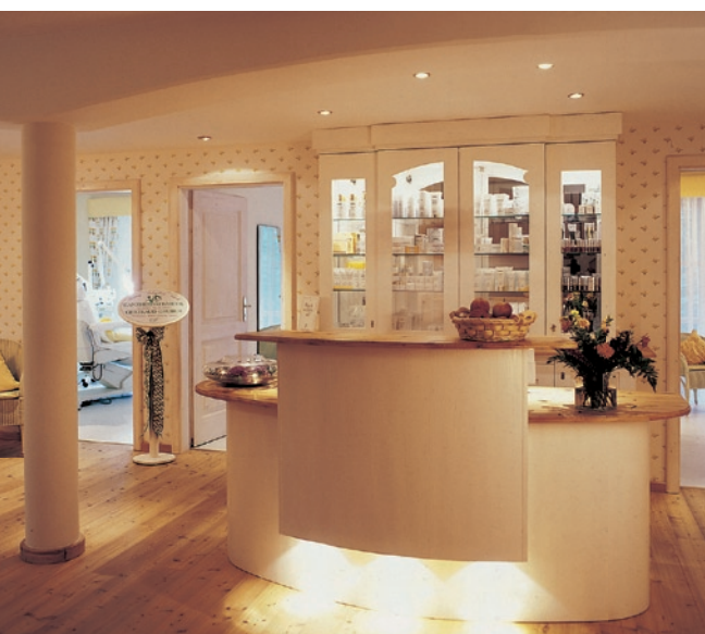
Fohlenhof: das Entree zum Behandlungsparadies