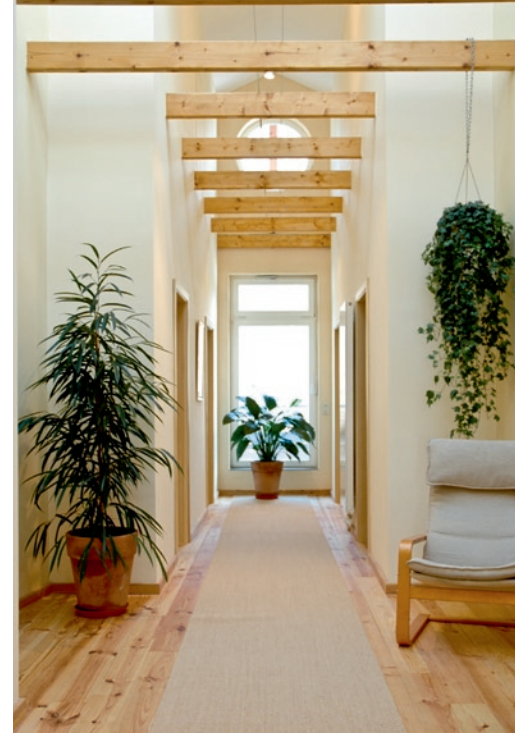
Stellshagen: Zugang zu den Behandlungsräumen

Stilvoll präsentiert sich das Hotel Gutshaus Stellshagen in Nordwestmecklenburg, im Klützer Winkel zwischen Lübeck und Wismar. Nur zehn Kilometer sind es bis zum Meer, weshalb man das Näschen nicht zu sehr in den Wind zu strecken braucht, um die prickelnde Meeresbrise in der ohnehin schon guten Luft auszumachen. Das prachtvolle Gebäude von 1924, umgeben von